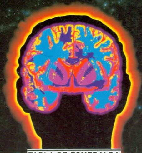
TABLA DE ESMERALDA Bolsillo